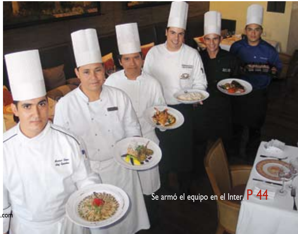
Se armó el equipo en el Inter. P 44

¿Qué medidas se toman para evitar la falta de agua en Papagayo?