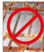
No se oxida