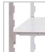
Fácil de limpiar

Para saber más acerca del sistema de almacenaje de Cambro, contacte su representante local. Contáctenos en www.cambro.com o llame al 1(714)848-1555