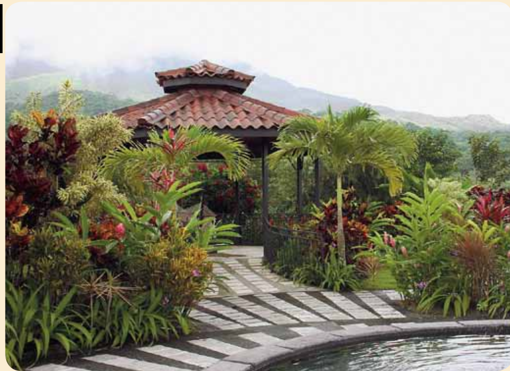
Propietario construirá más habitaciones