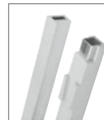
Fuerte y resistente